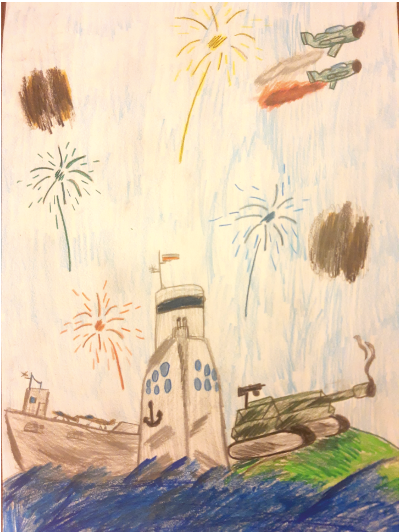
Wspomnienie Dnia Niepodległości